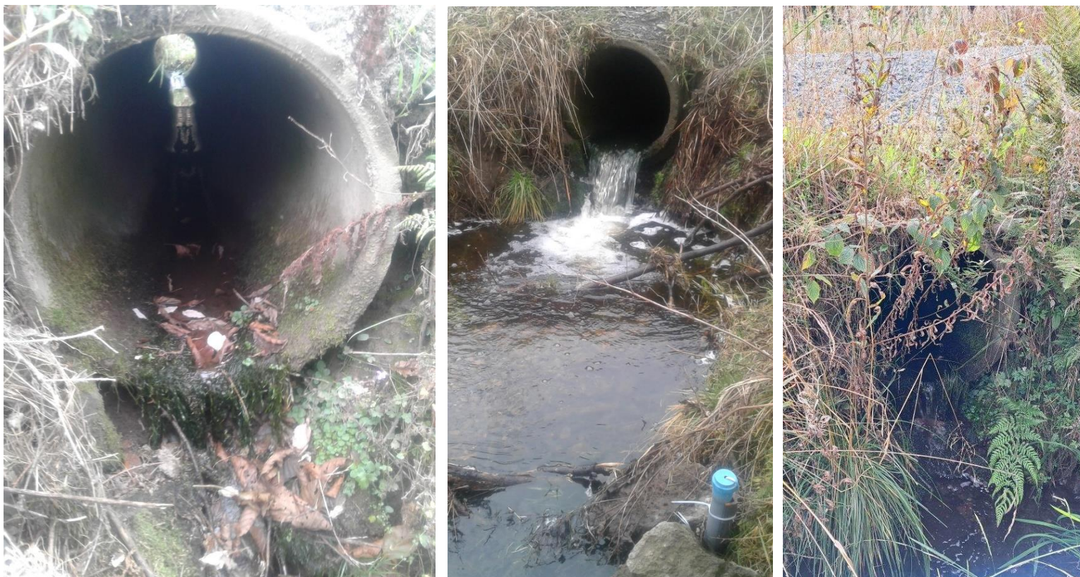
Bild 2: Speckenbach Querung L: November 22 M: März 23 R: September 23