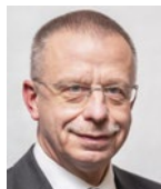
Lange, Frank AfD