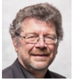
Sachtleben, Heiko B90/Die Grünen