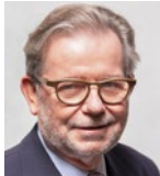
Schiesgeries, Horst CDU