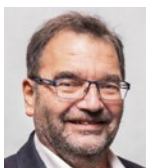
Enversen, Sabah SPD