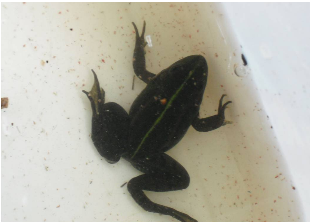
Abbildung 13: Teichfrosch in den Bombentrichtern des Mascheroder Holzes