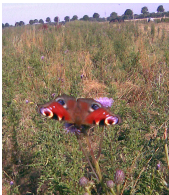
Abbildung 4: Tagpfauenauge in den Distelbeständen des Grünlandes