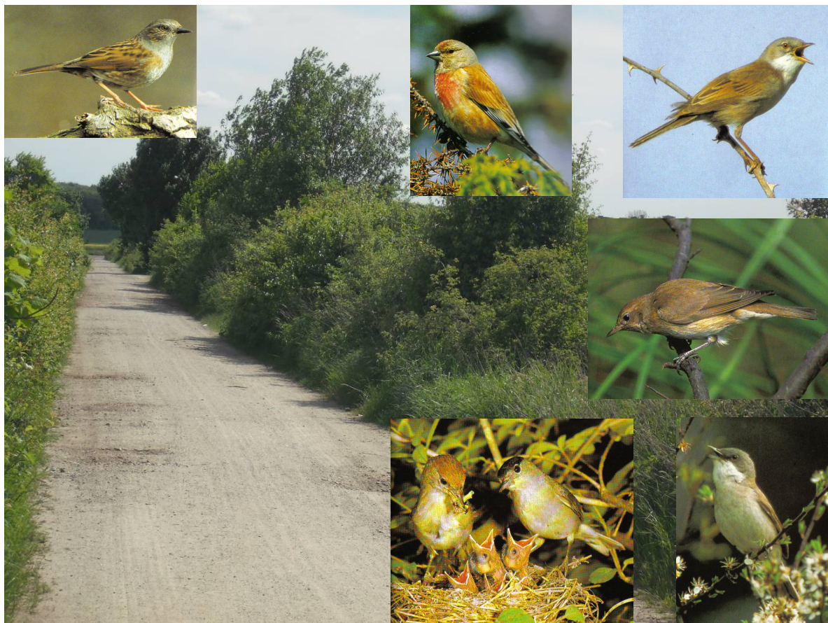
Abbildung 10: Feldweg mit Hecken von der L 632 zum Mascheroder Holz

(Vogelarten auf Abbildung: oben: Heckenbraunelle, Hänfling, Dorngrasmücke Mitte: Gartengrasmücke unten: Mönchsgrasmücke, Klappergrasmücke)