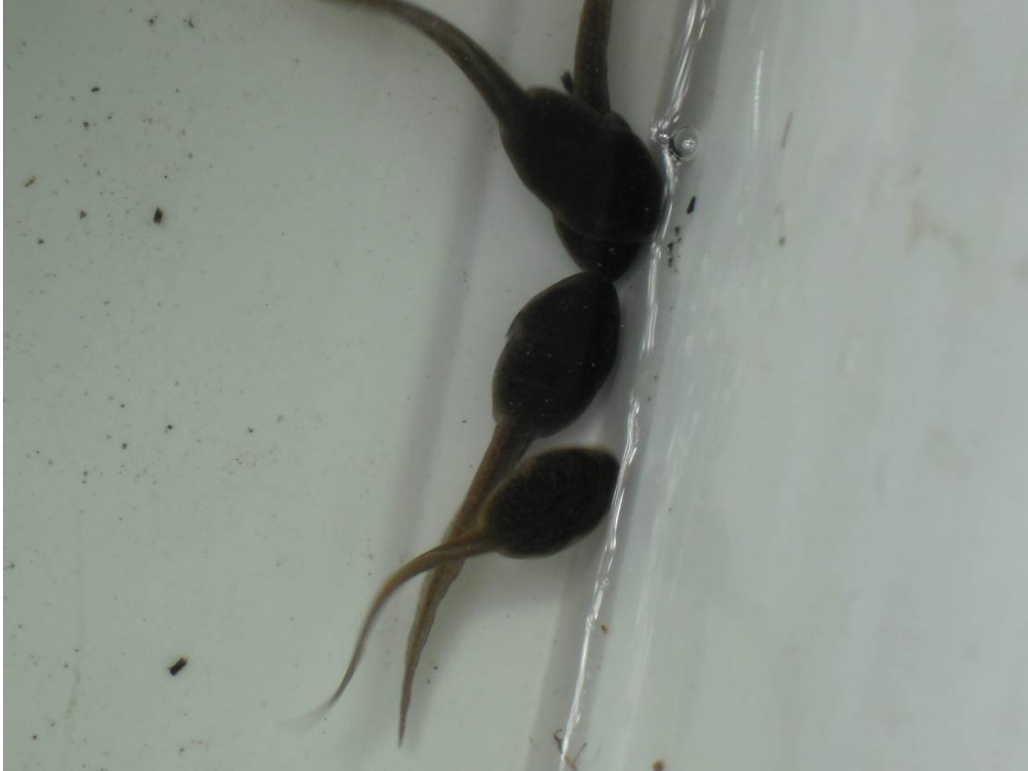
Abbildung 13: Kaulquappen der Erdkröte in den Bombentrichtern des Mascheroder Holzes