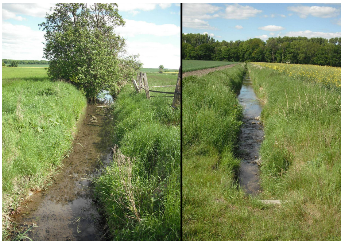
Abbildung 6: Springbach

(oben: Schwarzkehlchen [RL], unten von links nach rechts: Rebhuhn [RL], Feldlerche [RL], Wiesenschafstelze)