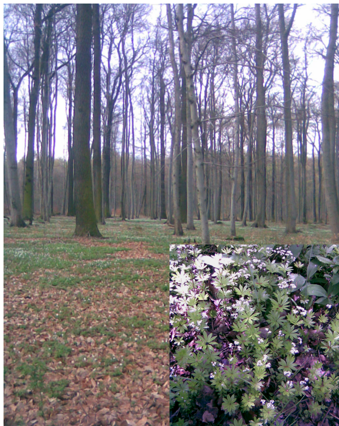
Abbildung 3: Mesophiler Buchenwald kalkärmerer Standorte des Berg- und Hügellandes (WMB) mit Buschwindröschen im April und Waldmeister im Mai (Oberdahlumer Forst)