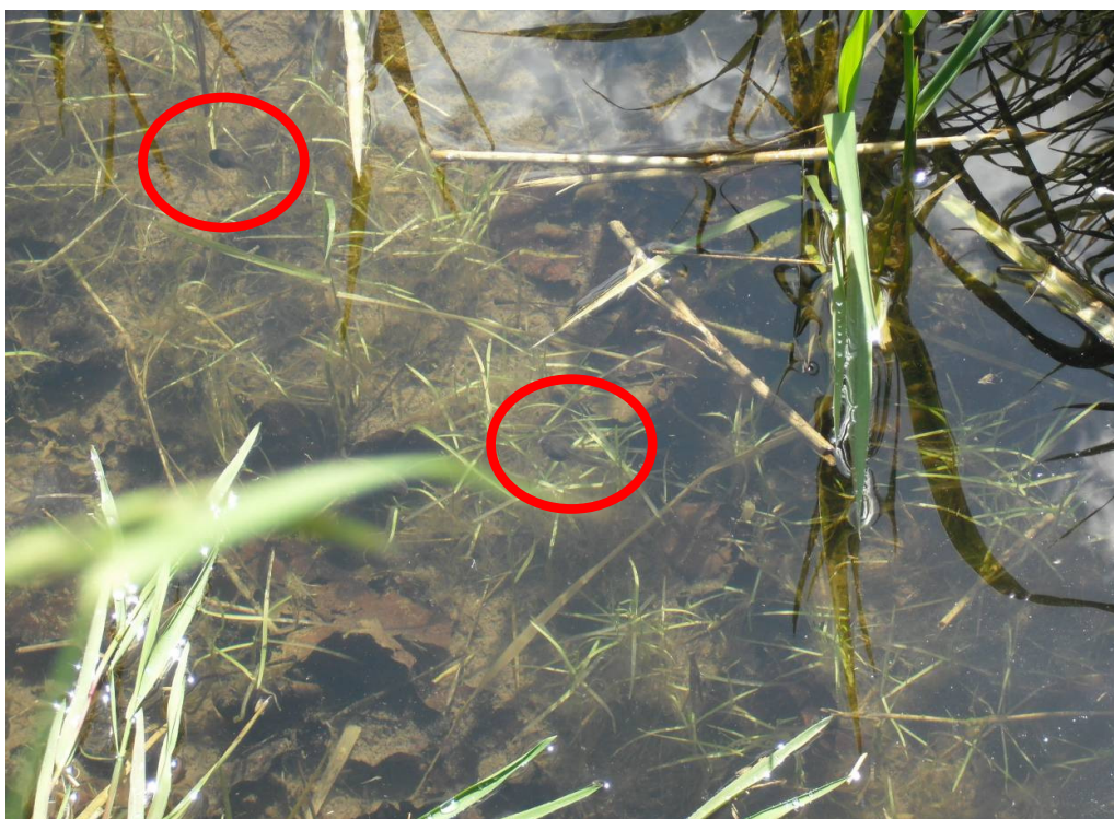
Abbildung 12: Kaulquappe des Grasfrosches im Grabensystem bei der Pappel