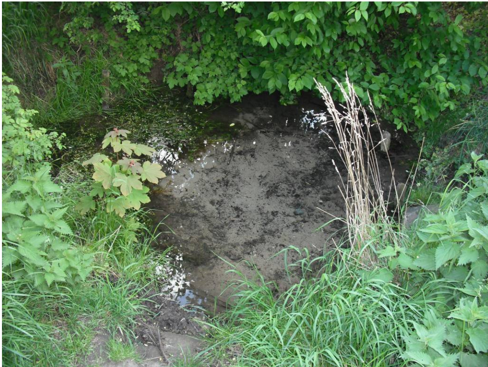
Abbildung 9: Quelle „Spring“, kleiner Quellteich