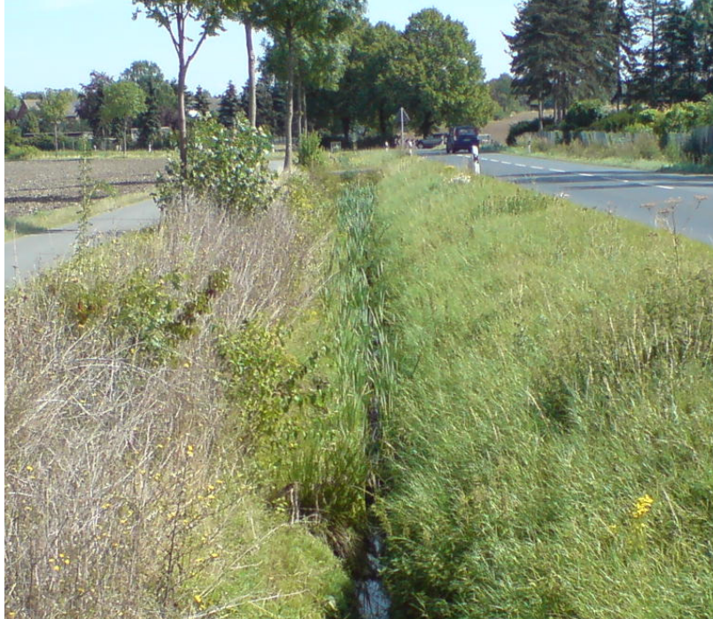
Abbildung 7: Entwässerungsgraben nördlich der L 632