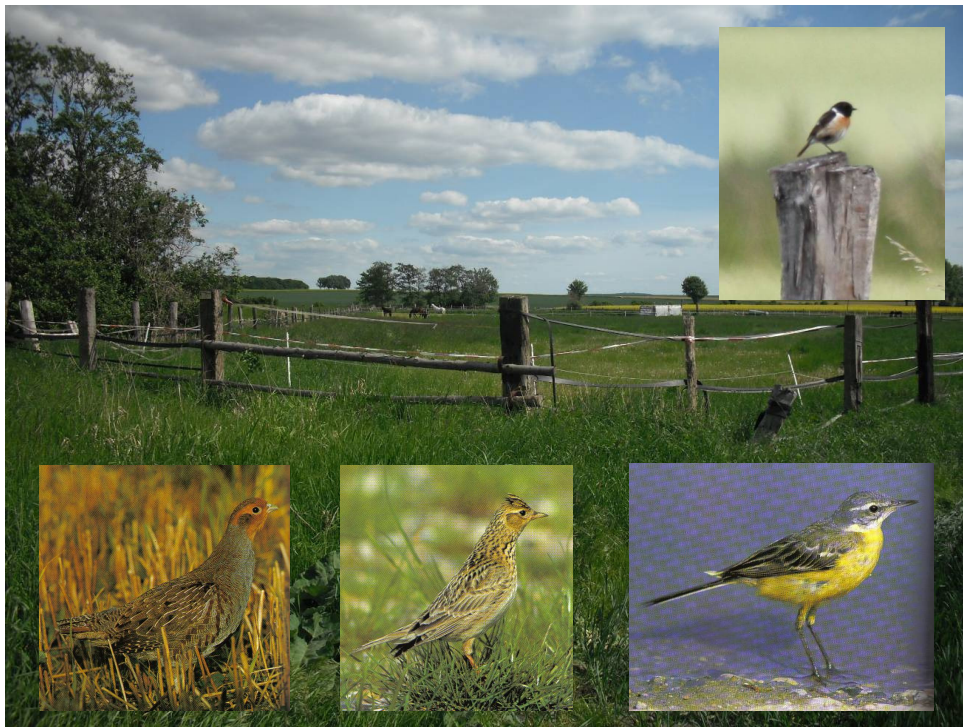
Abbildung 5: Grünland am Springbach: geschützte und typische Vogelarten

(oben: Schwarzkehlchen [RL], unten von links nach rechts: Rebhuhn [RL], Feldlerche [RL], Wiesenschafstelze)