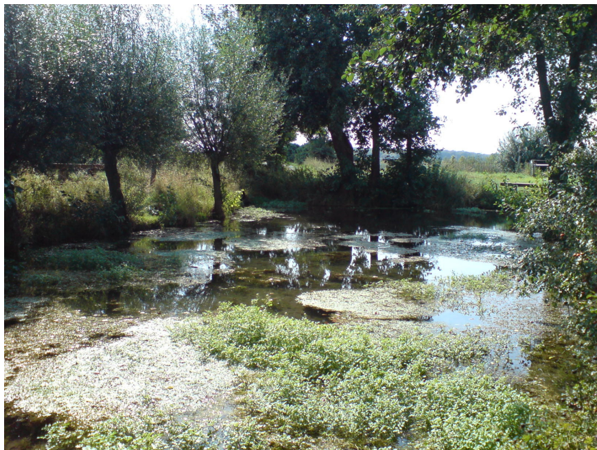
Abbildung 8: Quelle „Spring“, großer Quellteich