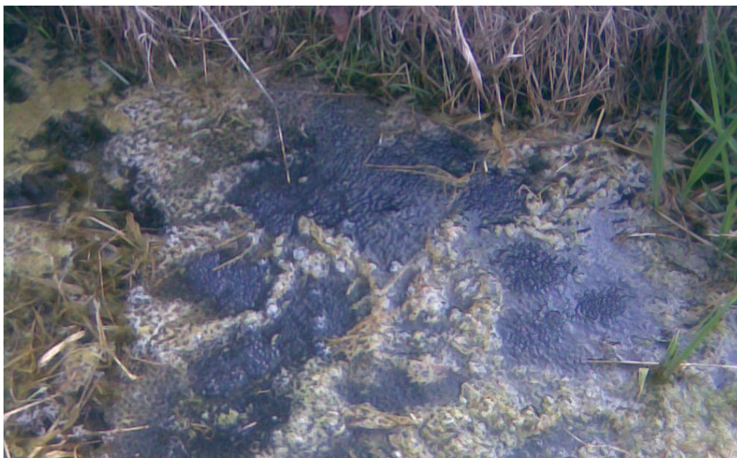
Abbildung 11: Grasfroschlaich im Graben nahe Stöckheimer Forst