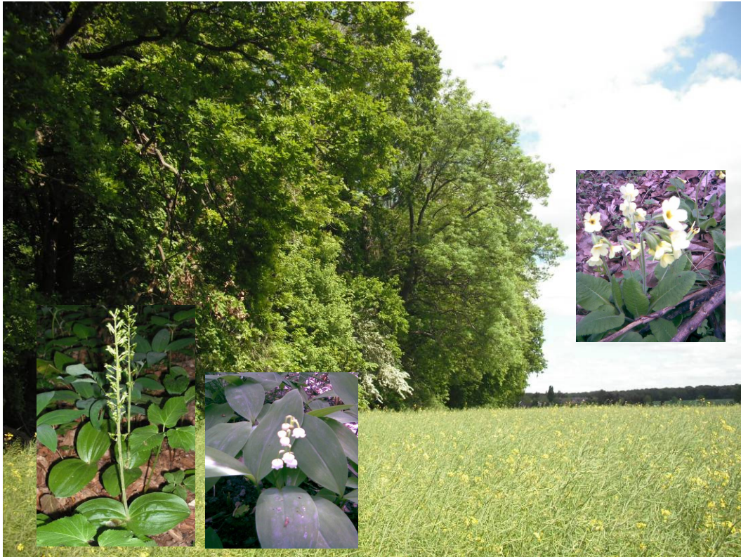
Abbildung 1: Waldrand Mascheroder Holz östlich Springbach – Vorkommen geschützter Frühblüher

Von links nach rechts: Eiförmiges Zweiblatt (§), Maiglöckchen (§), Hohe Schlüsselblume (§)